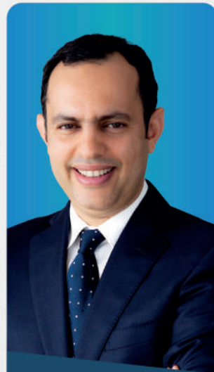
YOUNES SEKKOURI Ministre de l'Inclusion économique, de la Petite entreprise, de l'Emploi et des Compétences