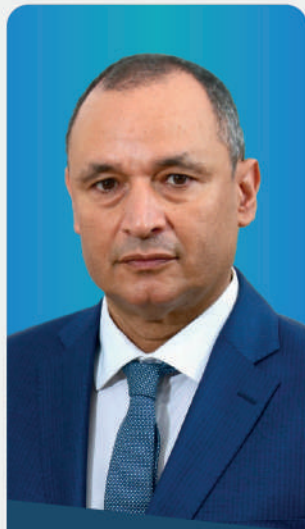
RYAD MEZZOUR Ministre de l'Industrie et du Commerce

INDUSTRY MEETING DAYS MOROCCO sont surtout l'occasion de réunir des experts et intervenants de haut rang afin de débattre des thématiques spécifiques à l'industrie porteuse de développement pour le Royaume.