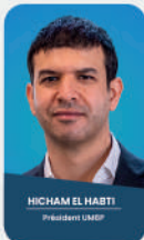
HICHAM EL HATTI Président UMP