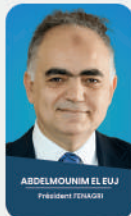
ABDELMOUNIM EL EUJ Président FENAGSI